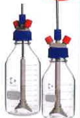
攪拌反応容器セット 1000/500mL