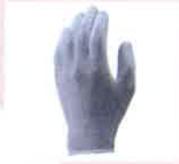
ESDプロテクトパーム