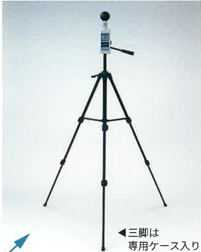
三脚は専用ケース入り

黒球温度の正確な測定には一定の高さが必要です。連続測定するためにも三脚のご使用をお勧めします。