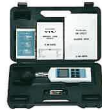
本体はハードケース入り(収納、保管用)