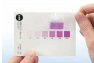
水質検査キット シンプルパック®